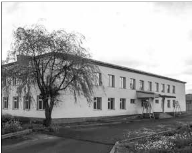
Ծղուկի միջնակարգ դպրոցը

Համայնքապետ Մերոպ Ամիրջանյանը եւ գյուղատնտեսի (ավարտել է գյուղմեխանիզացիայի ու էլեկտրիֆիկացիայի տեխնիկումը), եւ մանկավարժական (Երեւանի Խ. Աբովյանի անվան մանկավարժական ինստիտուտի ֆիզմաթ ֆակուլտետ) կրթություն ունի: Գյուղի կոլեկտիվ տնտեսությունն է ղեկավարել, նաեւ հայրենի Ծղուկի, ապա՝ հարեւան Բազարչայի կրթօջախների տնօրեն է եղել: Խորհրդատեսության տնօրեն է եղել, ապա երեք գյուղի (Բորիսովկա, Ծղուկ, Սառնակունք) գյուղխորհրդի նախագահ, 1991-ին երբ գյուղերը բաժանվեցին, Ծղուկի գյուղխորհրդի նախագահ՝ մինչեւ 1996 թվականը: Մարզի տարեց գյուղապետերից է: Պատմում է, որ 1905-06 թվականների հայ-թուրքական ընդհարումների ժամանակ, երբ Ղալաջուղ գյուղը բազմիցս ենթարկվեց հարձակումների, բնակիչների մի մասը տեղափոխվեց եւ բնակություն հաստատեց այստեղ: Երեւույթը կրկնվեց նաեւ 1918-20 թվականներին: Բնակչության մի մասն էլ ավելի վաղ ներգաղթել է այստեղ Խոյ-Սալմաստից, հավանաբար Թուրքմենչայի պայմանագրից հետո: Բորիսովկա եկան նաեւ բնակիչներ՝ Սիսիանի