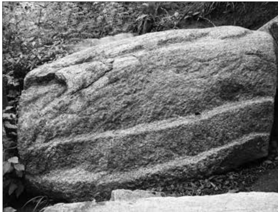
ՆՈՒՍԱՎՈՐԵ ԵՆՈՐԻՆ ԴԱՎԻԹՅԱՆ

Բաղիչեցու հիշատակարանում կարդում ենք. «Ետ Անանիայի եկաց հայրապետ Տեր Վահան ի Բաղայ (ինձ՝ Բաղաց) ամ մի որդի Ջուանշիրի իշխանին Բաղաց: Նա դաշնադիր եղև ընդ վրաց քաղկեդոնականաց և իմացեալ վարդապետք ժամանակին և հալածեցին զնա և նա փախստեամբ եկեալ ի Վասպուրական»(12):