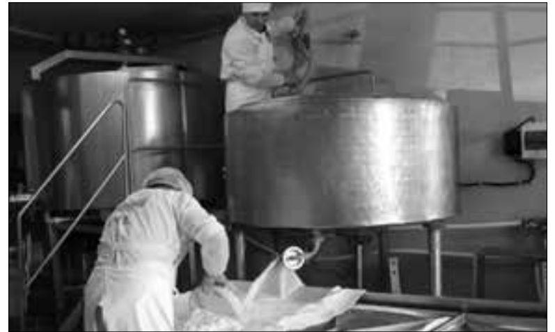
«Բորիսովկա» ՍՊ ընկերությունում